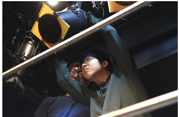
<교육 및 세미나>